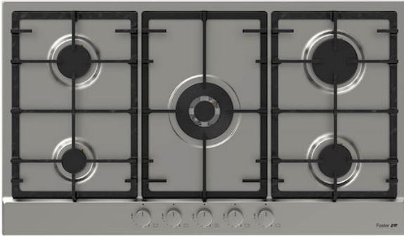
Table de cuisson Power